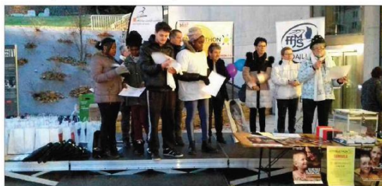
■ Remise symbolique du diplôme de bénévole aux jeunes très engagés.

La préparation de cette manifestation et leur présence toute cette journée, aux couleurs de l'amitié et de la solidarité, a permis aux jeunes de s'investir pour un engage-