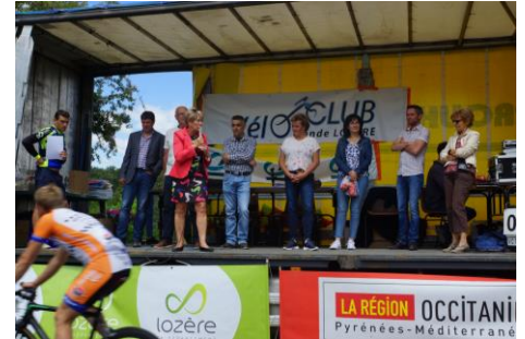
Course de la Tieule