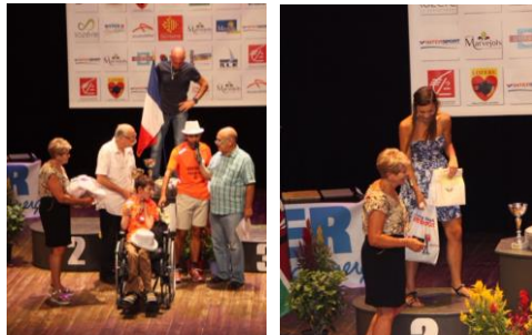
Remise des prix Marveïols-Mende