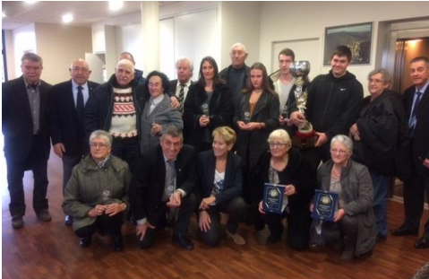
Remise des Trophées en AG régionale

Le Comité des Médailleurs était présent, tout au long de l'année, sur les manifestations sportives et caritatives, pour encourager et soutenir le bénévolat.