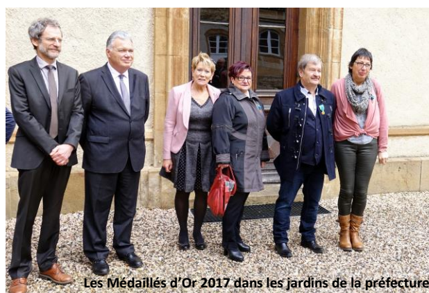
Les Médailles d'Or 2017 dans les jardins de la préfecture.