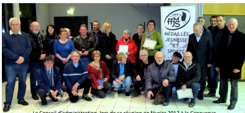
Le Conseil d'administration, lors de sa réunion en février 2017 à la Canourgue.