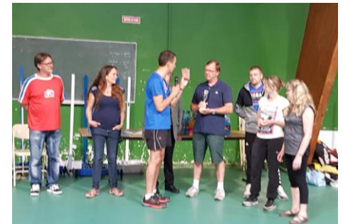
Finale de badminton à Marvejols