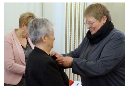
Médaille de Bronze.