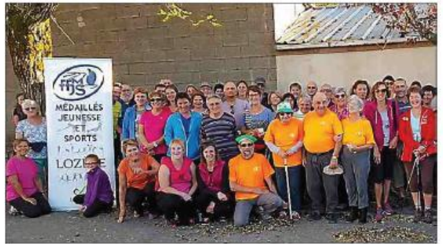
■ Le groupe qui a participé à l'édition 2016.