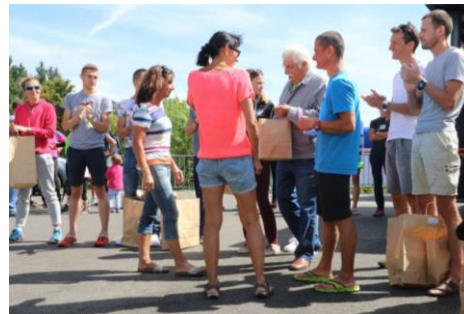
Course du Bois joli à Badaroux