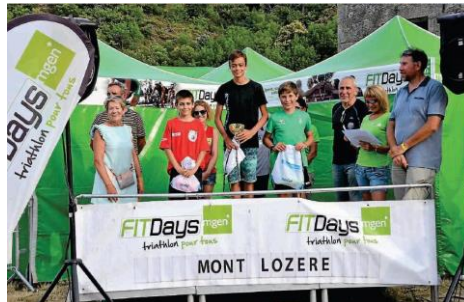
Les FitDays à Villefort