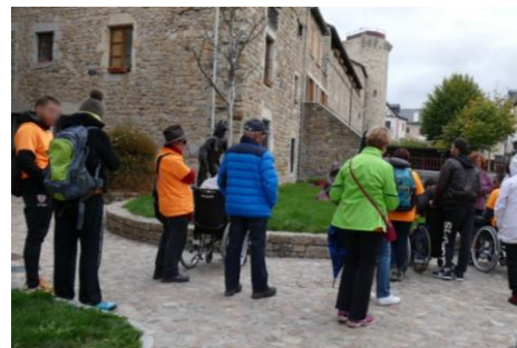
Marche pour la vue – Visite du Malzieu-Ville