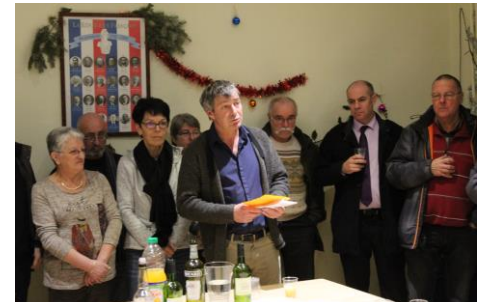
Février 2017 Téléthon des pompiers à Saint-Germain-du-Teil