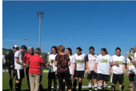
Coupe Lozère féminines à Mende