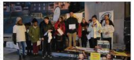
■ Le comité des Médaillés a remis des diplômes de bénévoles.

L'heure n'était pas à la polémique, samedi, en centre-ville de Mende, et personne ne boudait son plaisir de participer au Téléthon, qui se partageait les rues avec les animations de Noël. Du foirail à la place Chapital en passant par le casino, les bénévoles de diverses associations (que nous ne pourrions pas toutes citer ici) ainsi que des commerçants proposent de quoi s'amuser tout en faisant un don à la recherche médicale. Des bénévoles qui ont été récompensés en fin de journée, quand le comité départemental des Médaillés de la jeunesse, des sports et de l'engagement associatif remettait des diplômes de bénévoles aux responsables des différentes actions du week-end. Ils