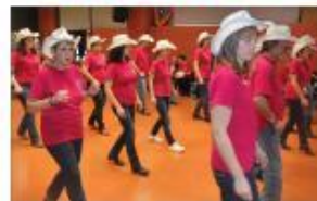
■ Convey passion et Yakhadzou en démonstration.