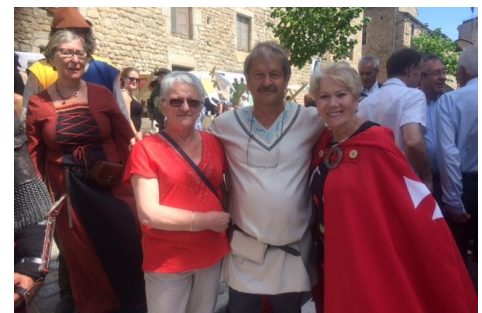
Médiévales du Malzieu