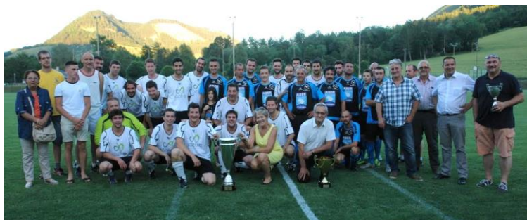
Finale de la coupe corpo de football au Chapitre à Mende