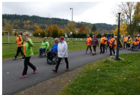
Marche pour la vue au Malzieu-Ville