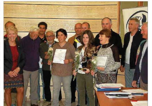
■ Des bénévoles des associations sportives et culturelles ont été mis en avant.