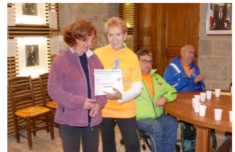
Marche pour la vue – Diplôme du Bénévolat à la guide