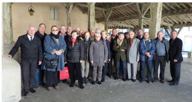
La commission d'attribution des Challenges régionaux s'est réunie le 27 novembre 2017, à Fanjeaux dans l'Aude.