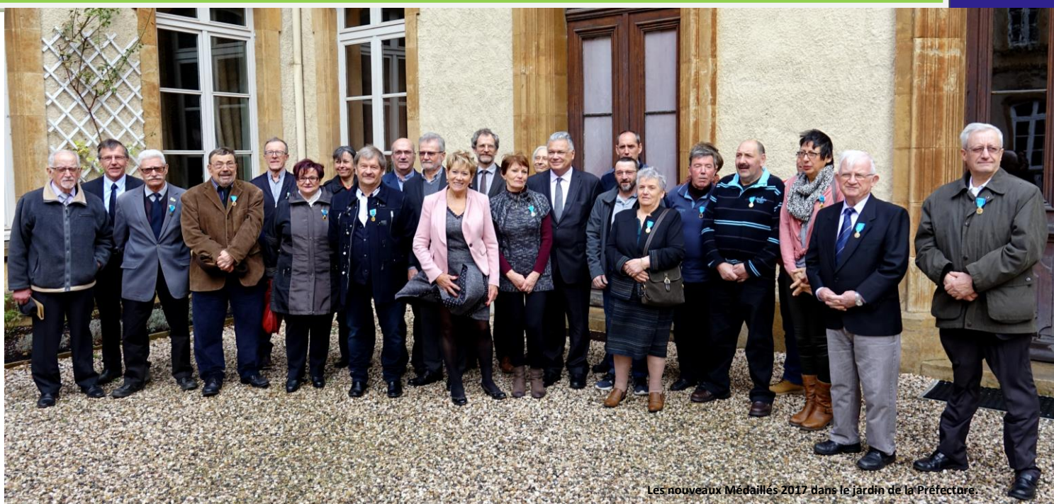
Les nouveaux Médailleurs 2017 dans le jardin de la Préfecture.

Comité Départemental des Médailleurs de la Jeunesse, des Sports et de l'Engagement Associatif de Lozère