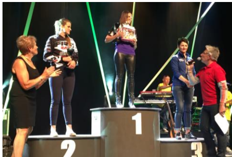
Remise des prix Trèfle lozérien