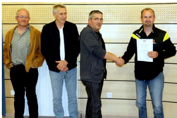
Remise des Lettres de Félicitations en 2017, dans les différents secteurs du département.