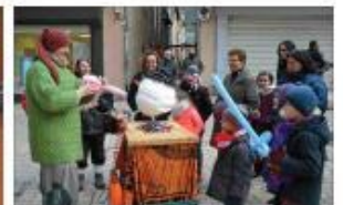
■ Le sculpteur de ballons, toujours très amusé!